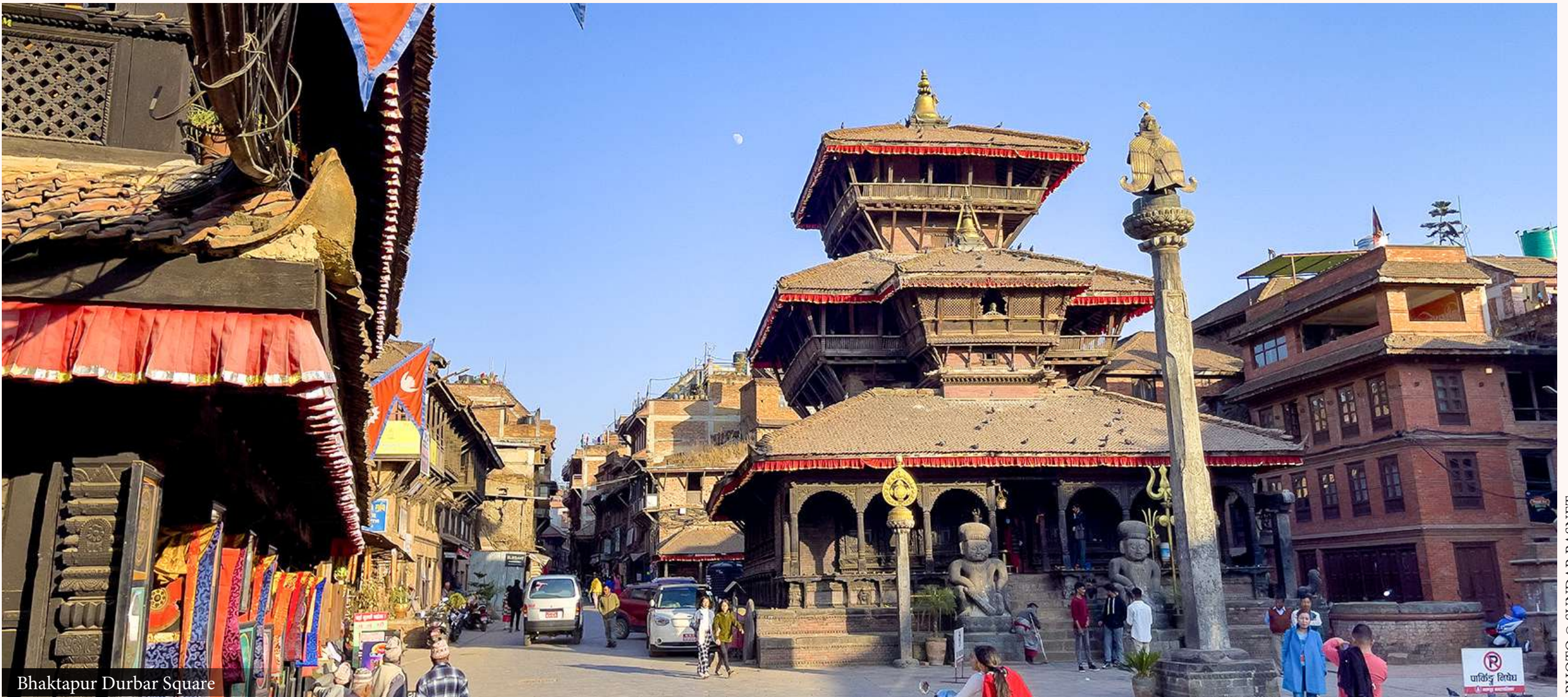
Bhaktapur Durbar Square