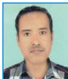
कुमार हमाल श्रीनगर(सल्यान) शाखा