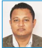
विकास श्रेष्ठ सिद्धार्थनगर शाखा