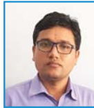
निसान अधिकारी रजहर शाखा