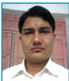
कैलाश चन्द्र सोलावाङ्ग(रुकुम) शाखा