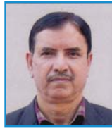
कुसेश्वर प्र. अधिकारी कम्पनी सचिव