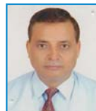
डिल्ली राज पौडेल बुढानिलकण्ठ शाखा