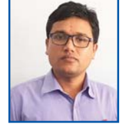
निसान अधिकारी ओदारी शाखा, कपिलवस्तु