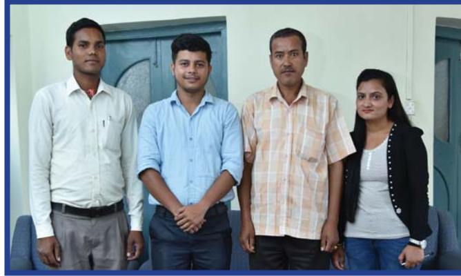
सल्यान र रूकुम शाखा