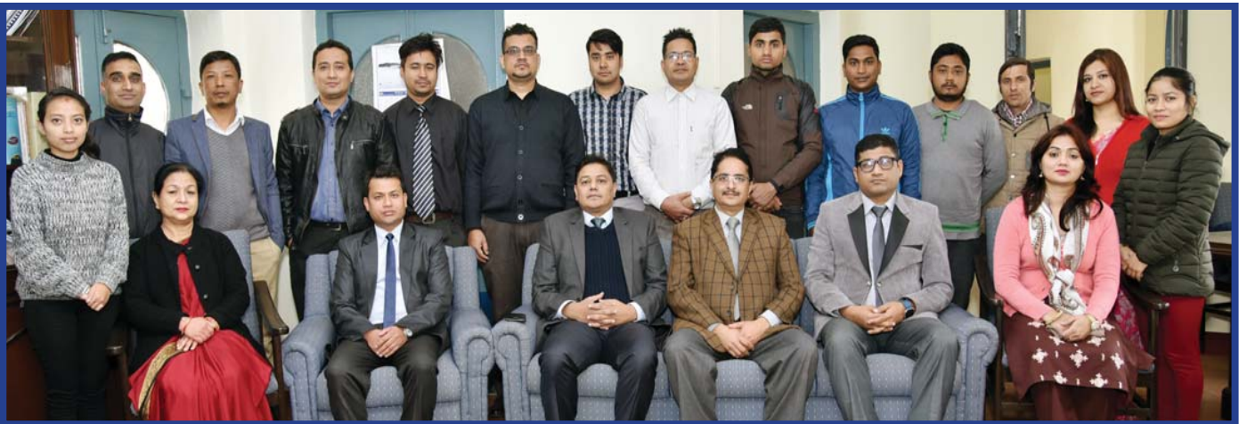
केन्द्रीय कार्यालय, डिल्लीबजार, काठमाडौं